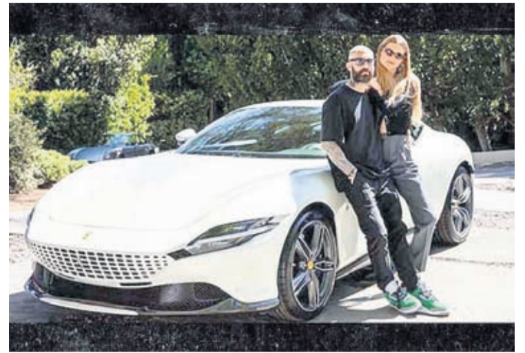
mil dollar pero esaki ta parece un clasico, gana, gana, gana. Puntra Adam.

Den cuanto e subasta di caridad, save the children a traha incansablemente durante covid-19 pa sigura cu e muchanan desafortuna tin buknan, suministro y heramientanan virtual di aprendisaje, por loke e placa ciertamente lo wordo destina na un gran luga. No sa ken a deposita e 750